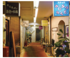
昭和レトロな飲み屋が連なるビルの中にある