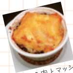
牛ひき肉とマッシュポテトのオープン焼き