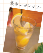
最氷レモンサワー