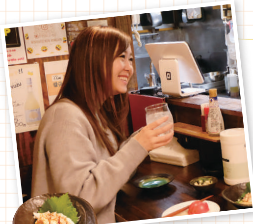
鶏ささみの卵黄ユツト