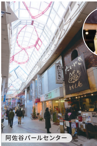
阿佐ヶ谷パールセンター

JR阿佐ヶ谷駅南口から丸ノ内線南阿佐ヶ谷駅の間にあるアーケード型の商店街、パールセンター。「ともえ庵」のたい焼きが人気。